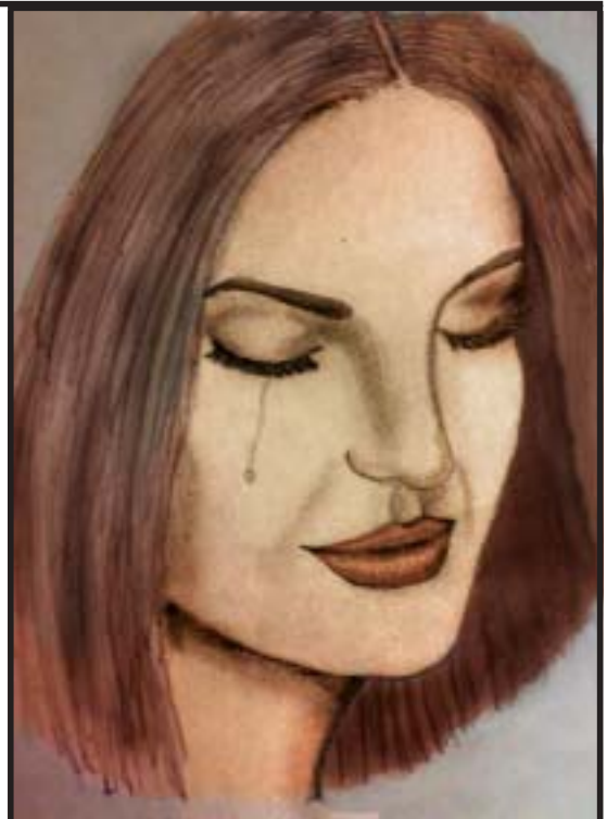
Pencil drawing by Master Arun Gopi S/o. of Er. P.K.Gopi