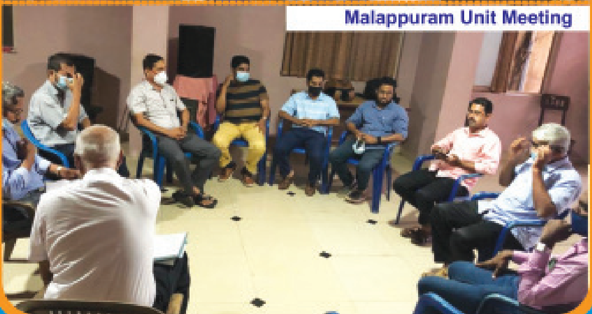
Malappuram Unit Meeting