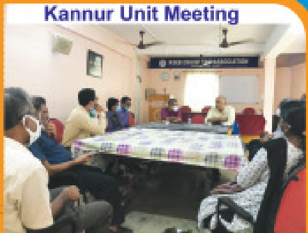
Kannur Unit Meeting