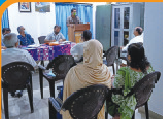
Kasaragod Unit Meeting