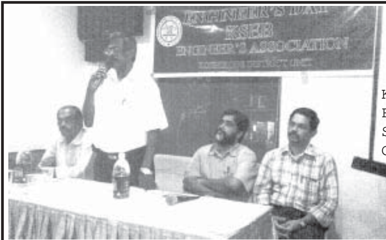
Kozhikode unit conducted Engineers day 2010 on September 15 at Hotel Grande, Kozhikode.