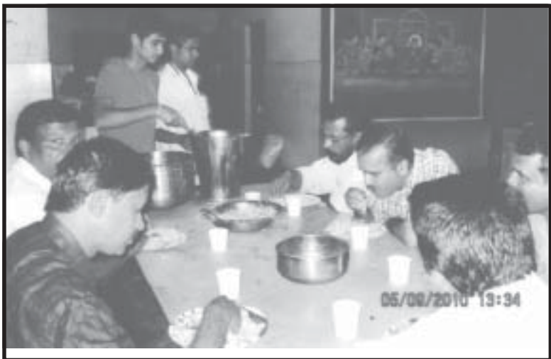
സ്നേഹാലയത്തിലെ ആകാശപ്പറവകൾക്കൊപ്പം ഓണസദ്യയുണ്ണുന്ന കാസർഗോഡ് യൂണിറ്റിലെ എഞ്ചിനിയേഴ്സ് അസോസിയേഷൻ മെമ്പർമാർ